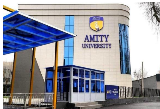
Тошкент шаҳридаги Амити Университети