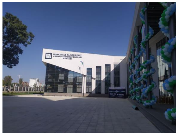
Муҳаммад ал-Хоразмий номидаги АКТга ихтисослаштирилган мактаб