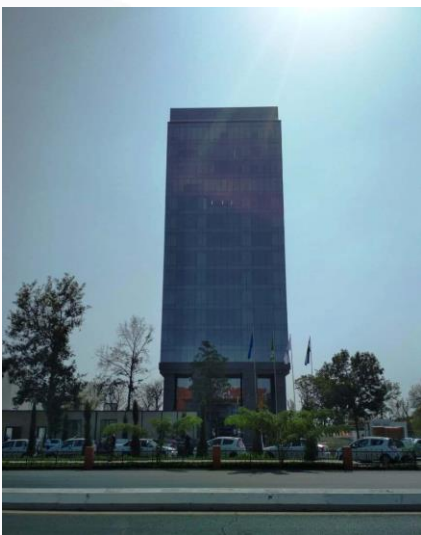
ИТ Парк Тошкент шаҳар филиали