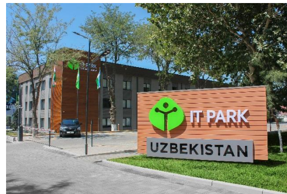
ИТ Парк маъмурий биноси