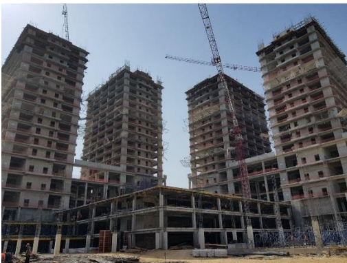
ИТ Парк ҳудудида қурилаётган биноларга киритилаётган инвестиция маблағлари